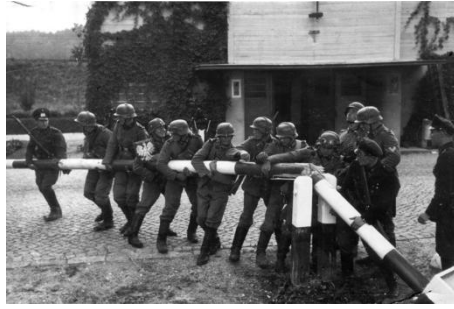
Germans breaking the Polish border post (propaganda picture).