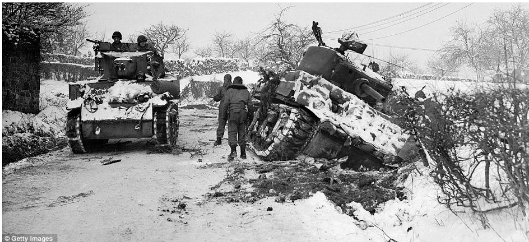
The Battle of the Bulge

In 1944 the USA declared war against the Third Reich. On 6 June the Operation Overlord started. About 150.000 soldiers landed in Normandy in France. It was a nail in the Third Reich's coffin. The allied offensive took control over France and a part of Belgium until the end of September 1944. Taking control over the Netherlands was just a matter of time (after the Operation Market Garden – biggest drop of paratroopers in history). It was planned very quickly and it wasn't perfect – it ended up with more casualties and the battle on the front stopped for a few months in Ardennes. Finally, the allied army broke the front and on 25 April met the Soviet army on the Elbe river.