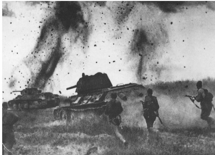
Battle of Kursk (1943)