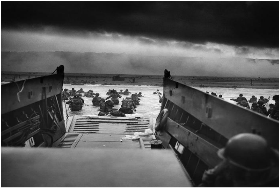
The D-Day in Normandy 1944