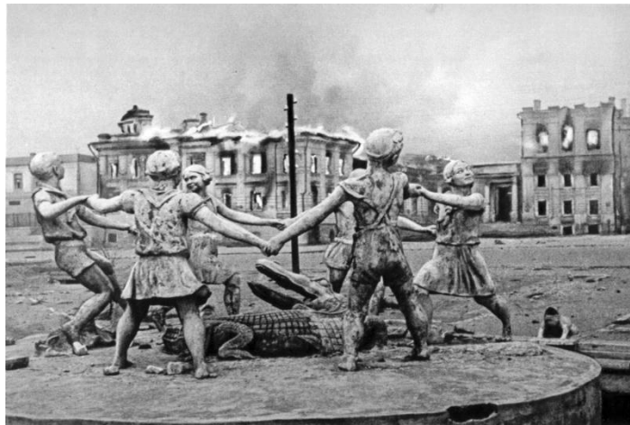
Barmaley Fountain in Stalingrad (symbol of the battle)

On 22 June 1941 Hitler unexpectedly attacked the Soviet Union. During first months of the 'Operation Barbarossa' USSR suffered lots of casualties among soldiers and lost much of its equipment. Finally, the Soviet army and very strong Russian winter stopped German troops about 30 kilometres from Moscow. Also Leningrad defended itself successfully. Eventually, Germans lost the battle of Stalingrad, the city located on the Volga. The Soviet army surrounded them and captured lots of prisoners of war. This was the time of the great Soviet counter-offensive which was stopped at Kharkov. Wehrmacht tried to carry out a counter-offensive in the battle of Kursk in 1943. However, German forces lost and it was the end of the German offensive on the eastern front – the Soviet army was almost unstoppable till the fight against Russians.